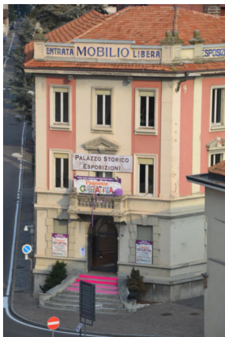
FOTO ESTERNO PALAZZO STORICO DELLE ESPOSIZIONI

Tre piani espositivi con una superficie di 1.800 mq.