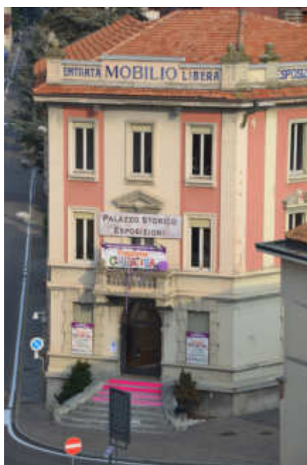
FOTO ESTERNO PALAZZO STORICO DELLE ESPOSIZIONI

Tre piani espositivi con una superficie di 1.800 mq.